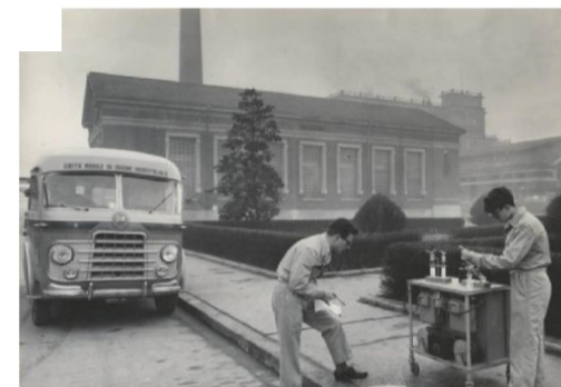
Il Laboratorio di Igiene Industriale e Tossicologia, 1962