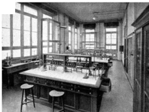
La Clinica del Lavoro e il Laboratorio di Chimica, 1910